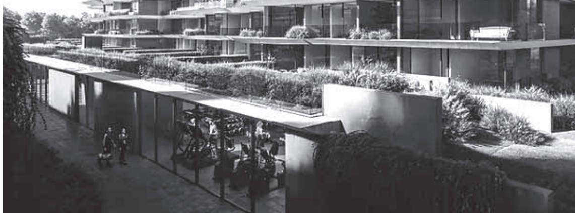
Imagen que representa el proyecto inmobiliario rechazado por vecinos y concejales del peronismo también.

Para el intendente Ramón Lanús (PRO-LLA), el inicio de julio podría inscribirse en las páginas negras de su gestión. Si su alicaída gobernanza había logrado oxígeno durante el 2025 y en lo que va del año, los yerros políticos, pero sobre todo el